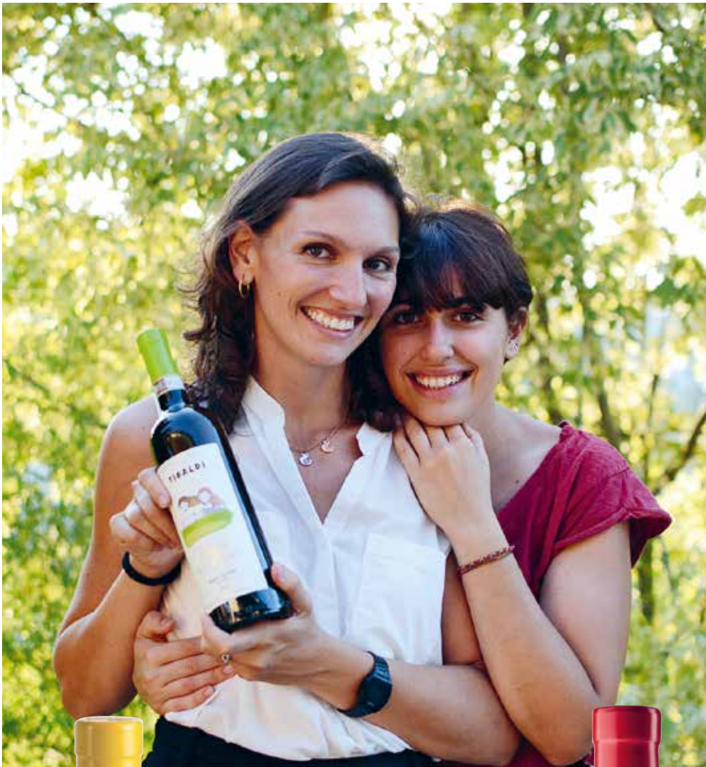
– Le sorelle Tibaldi –