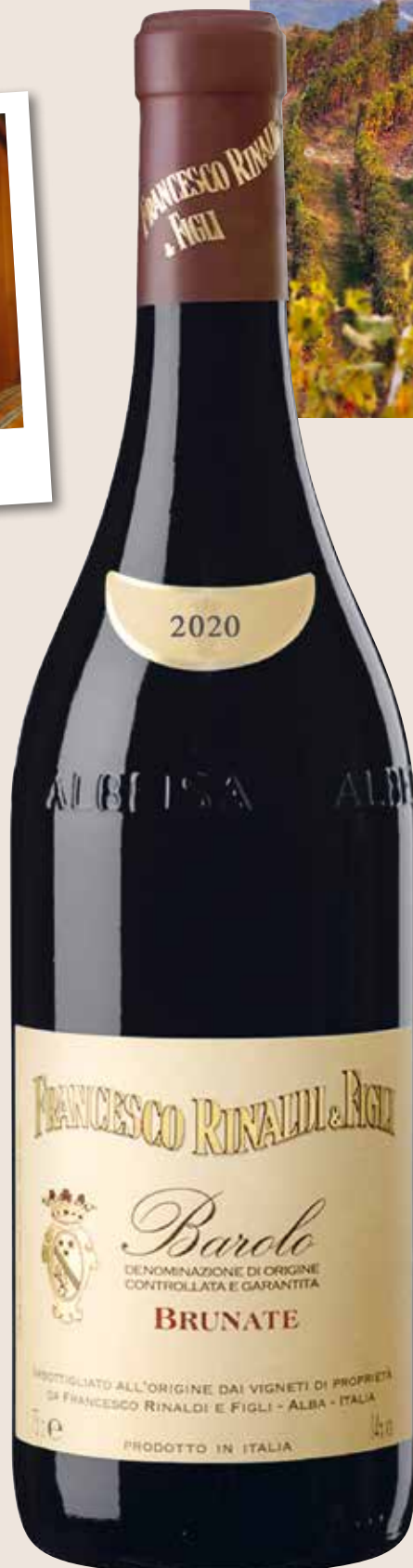
– Sicht auf die Lage «Brunate» –