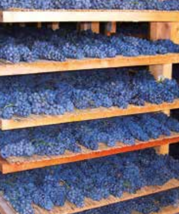
Trauben zur Trocknung im «Frutaio»