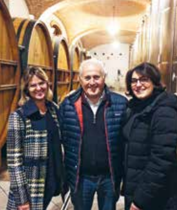
La famiglia Scavino