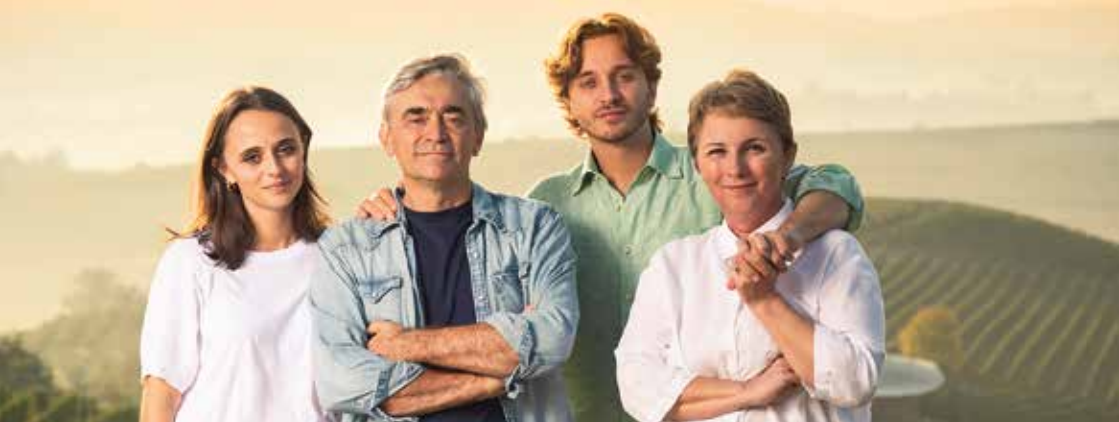
La famiglia Penna-Currado