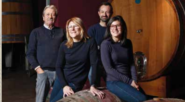
Crème de la Crème in Sachen Barbaresco-Winzer: la famiglia Sottimano.