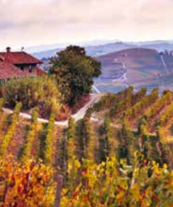
Sicht auf die Lage «Brunate»