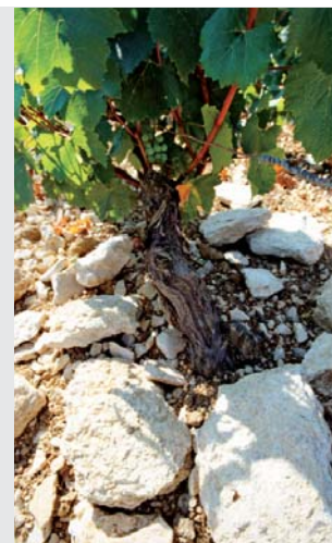
Typisches Chablis-Terroir: kalk- und fossilhaltiger Kimmeridgian-Boden.

Was für ein superfeiner Duft mit einer unglaublichen Komplexität. Delikate, erfrischende Zitrusfrucht, gelbe Frucht, feinste florale Noten und ein Hauch Minze. Es zeigt sich eine intensive mineralische Nase – es duftet förmlich nach nassem Gestein. Die Fruchtnoten sind präsent und doch kaum wahrnehmbar – extrem fein und zart. Im Gaumen zeigt sich diese knackige Säure und perfekt ausbalancierte Aromatik. Wer Mineralität und Frische sucht, ist hier genau richtig. Ein ganz grosser Chablis in Hochform.