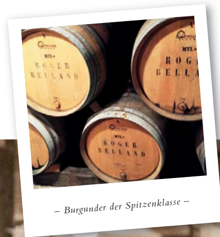
– Burgunder der Spitzenklasse –