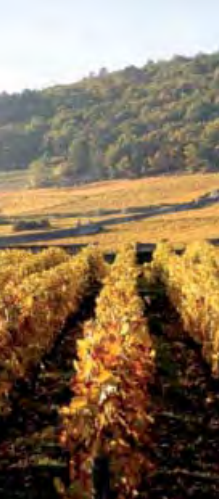
Sicht auf Clos St. Jacques

■ Domaine Armand Rousseau, Gevrey-Chambertin