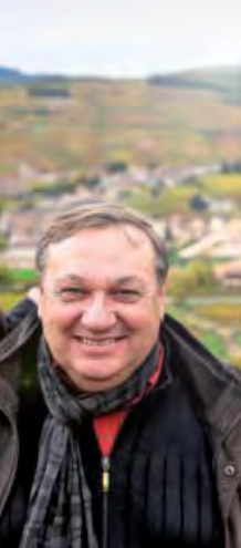
«Lebendige Weine mit Charakter.» Jean-Jacques Robert