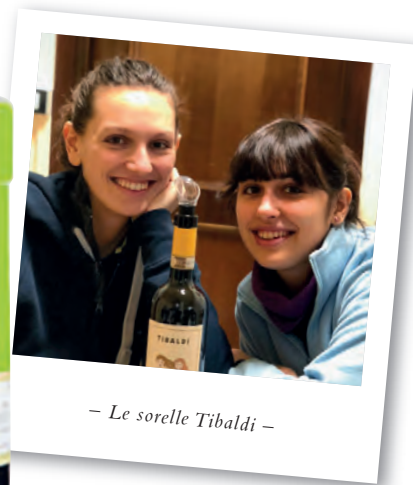
– Le sorelle Tibaldi –