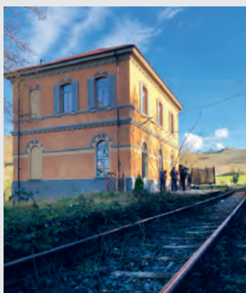
– Fletcher Station –

Achtung, fertig, los! Erster Staderi-Jahrgang von Fletcher und dies gleich im Spitzenjahr 2016. Definitiv eine grosse Rarität: nur 300 Flaschen und 70 Magnums wurden abgefüllt. Stammt 100% aus Staderi, ganz im Norden der Barbaresco-Appellation, einer der renommiertesten Lagen in Neive mit optimaler Südwest-Ausrichtung und bekannt für langlebige Weine. Gleich vinifiziert wie sein kleiner Bruder Recta Pete, weist der Staderi noch eine Spur mehr Eleganz und Intensität auf. Wie alle Weine von Fletcher sehr pur und präzise. Wirkt zunächst etwas delikater wie der Recta Pete, spielt dann aber im Finale seine Stärken aus. Leicht süssliche rote Frucht beim Antrunk, schöner direkter Zug am Gaumen, extrem noble Tannine und fantastische Länge mit viel Klasse und Stil. Wir können Dave zu diesem Erstlingswerk nur gratulieren!