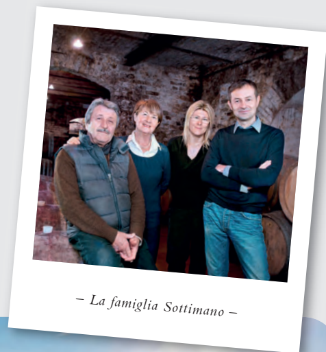
– La famiglia Sottimano –

Das war ein wirklich lohnenswerter Besuch: Wir haben ein neues Weingut gefunden, das perfekt in unser Portfolio passt! Liebe Kundinnen und Kunden, lassen Sie sich auf die Weine von Sottimano ein. Natürlich brauchen sie einige Jahre Zeit, um ihr volles Potenzial entfalten zu können. Darum bieten wir auch den Langhe Nebbiolo an, er ist – ohne Kompromisse bei der Qualität – früher trinkreif! Freuen Sie sich mit uns auf die Weine von Sottimano. Sie werden von der Klasse der Gewächse begeistert sein.