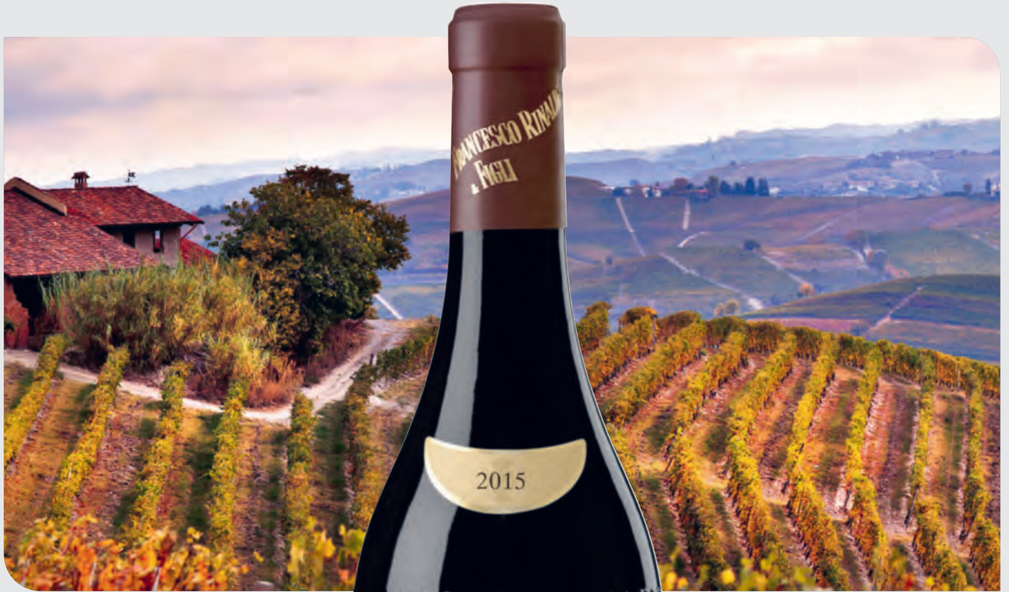
– Sicht auf die Lage «Brunate» –

Unsere Reise beginnt im traditionellen Weingut Francesco Rinaldi, direkt auf dem weltberühmten Cannubi-Hügel, auf der hochgelobten Parzelle Cannubi Boschis. Wir sehen von hier aus die Top-Lagen um Barolo und La Morra, unter anderen auch «Brunate», die zweite Top-Lage von Rinaldi.