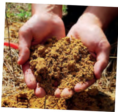
– Typisch für das Alto Piemonte: sandhaltige Böden –