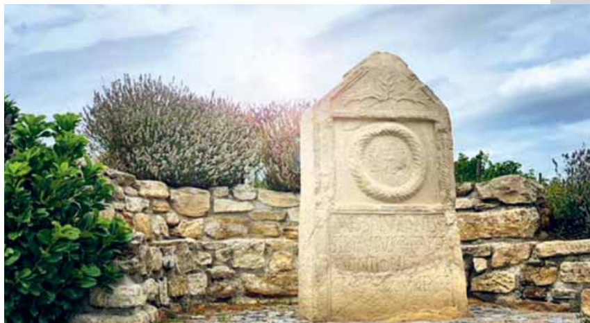
Der Stein des Anstossens: Das gut 2000 Jahre alte Relikt mit den zwei eingemeisselten, Wein einschenkenden Frauen.