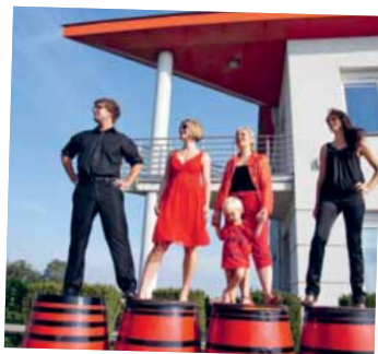
– Generation Pöckl –